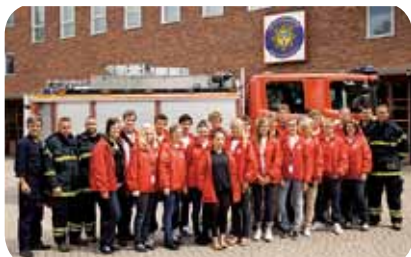
Några av ungdomar på brandstationen i Nyköping för genomgång och utbildning.

Under sommaren genomförde vi i samarbete med räddningstjänsten i Nyköping och Eskilstuna ett brandvarnarprojekt med dubbla syften - att ge ökad trygghet för våra äldre kunder samt sysselsättning åt ungdomar.