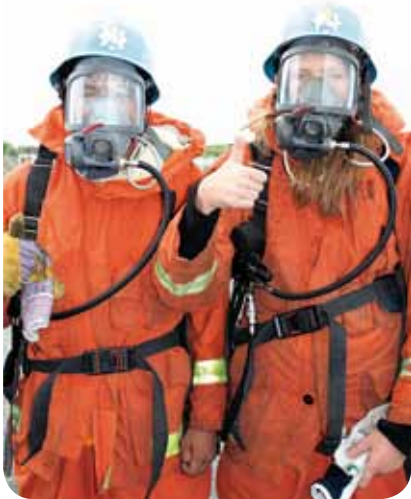
Övning i rökfylld lägenhet.