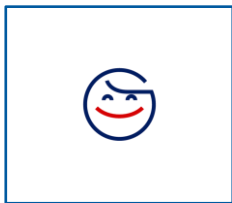
Bengt Ericson Född: 1970

7 ledamöter, varav en (1) plats är vakant.